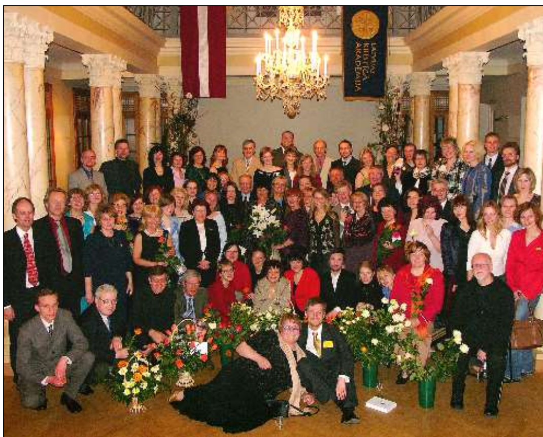
Latvijas Kristīgās akadēmijas māceklības 12 gadu konferences dalībnieku kopīgs foto.